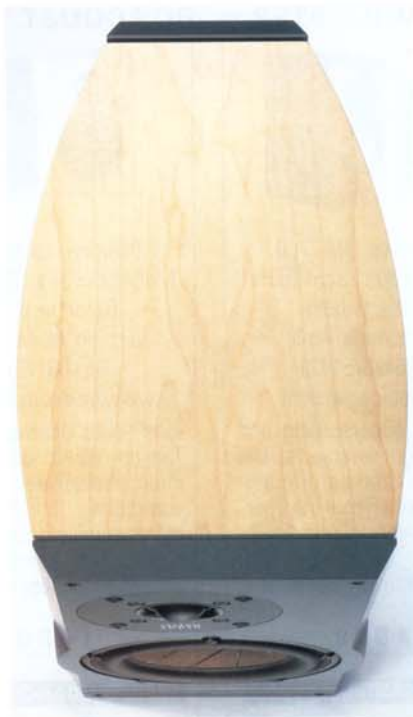
Die seitlich geschwungenen Gehäuse der SA2K werden aus einem einzigen Stück Holz gefräst. Verarbeitungsqualität ohne Limits

Der Auftritt im Hörraum ist entsprechend imposant. Diese kleinen Gehäuse liefern ein Bassfundament, das den Zuhörer vom Fleck weg umhaut. Das geschieht außerdem in solch unbeschreiblich bestechender Qualität, das man es kaum fassen kann. Ultra-dynamisch, völlig ansatzlos und mit messerscharfen Konturen. Umwerfend. Der Mittel-Hochton-Bereich überzeugt nicht minder. Stimmen tönen völlig schwerelos und voller Lebendigkeit. Räume werden nicht in ihren Abmessungen fassbar, sondern verraten auch ihre materielle Beschaffenheit. Ein sagenhaft ehrlicher Lautsprecher, der puren Hörspaß in allen Parametern liefert. Kritikpunkte? Fehlzanzeige. Die SA2K ist rundum perfekt!